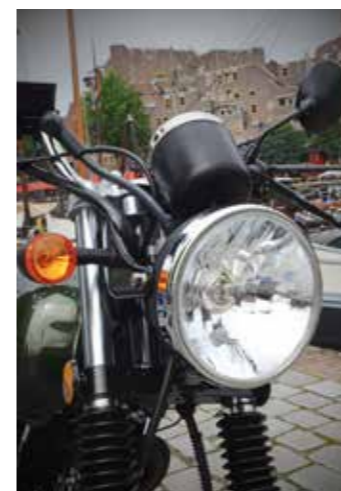
Klassieke blik vanuit een helder glaasje

Hanway betreedt met de RAW50 het segment van de 50cc café-racers. Nostalgisch en back to basic en inclusief alle kenmerken die je van een klassieke bromfiets zal verwachten. We deden ons 'potje' op en maakten ons op voor een kennismaking met de nieuwe Hanway!