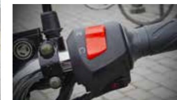
Starten doe je elektrisch...