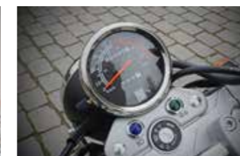
Een duidelijke analoge snelheidsmeter inclusief een versnellingsindicator