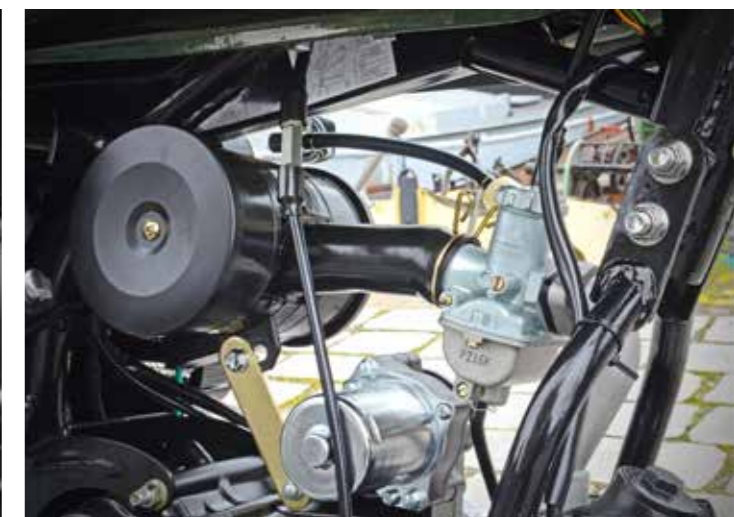
Nee geen injectie, een 16mm carburateur geleidt het mengsel richting de cilinder