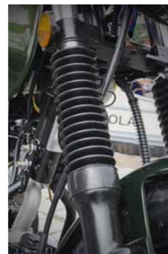
Door de geplaatste rubbers maakt steenslag en daarmee lekkage geen kans

soepel afgestelde achterveer, precies zoals het hoort. Tijdens de test zag ik een verkeersdrempel net even over het hoofd waardoor ik er ook veel te hard overheen 'vloog'. Tot mijn verbazing bleef een doorslaande