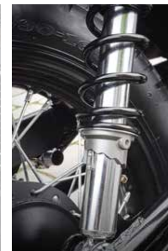
Instelbare veervoorspanning op de dubbele achterveren aan de achterzijde