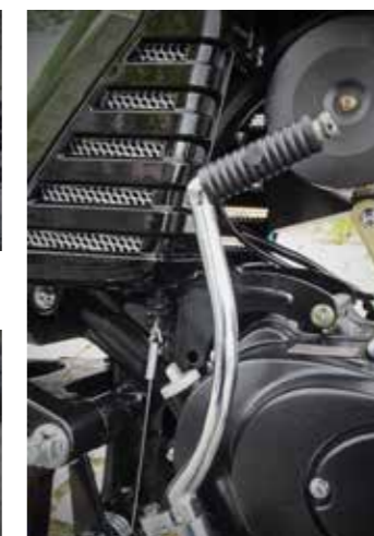
...of met de 'retro' kickstarter